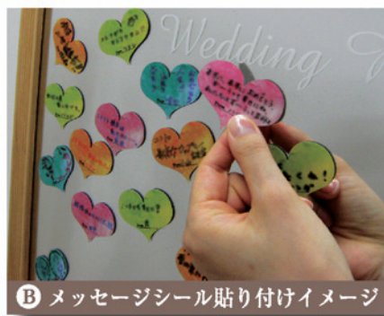
B メッセージシール貼り付けイメージ