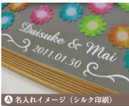
A 名入れイメージ (シルク印刷)