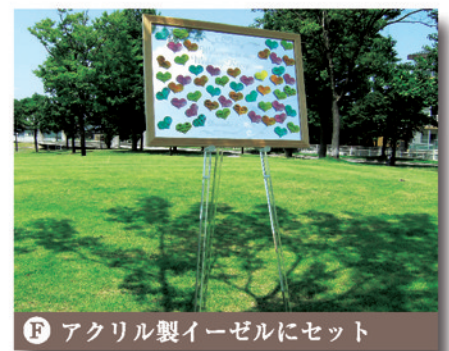
F アクリル製イーゼルにセット