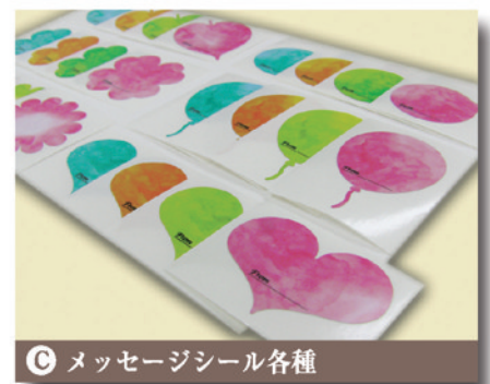
C メッセージシール各種