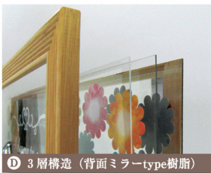
D 3層構造 (背面ミラーtype樹脂)