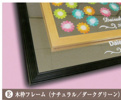
E 木枠フレーム (ナチュラル/ダークグリーン)